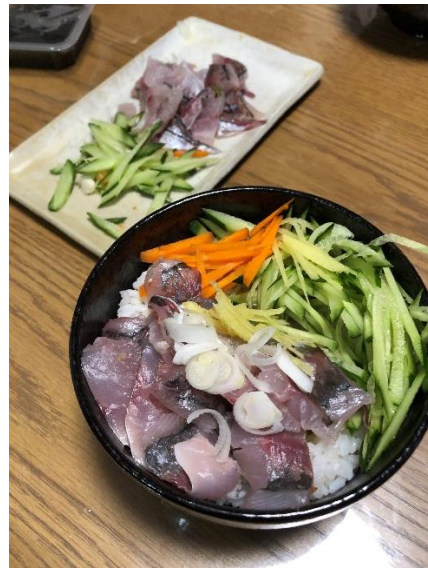
アジのつけ井大盛と刺身