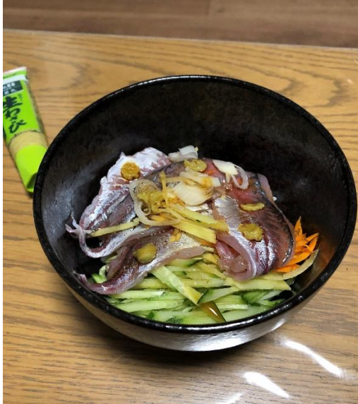
アジの三枚おろしのつけ井