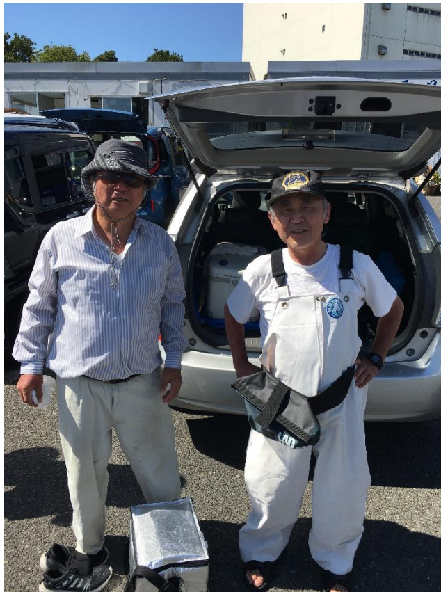
左から、碓会員、佐熊会員

東京都心、内陸部は体温を超える猛暑日が続き、釣行を心配しておりましたが、船の上は海風も心地よく、そんな厳しくもない、いつもの夏のピーカン船釣りでした。ただし、脱水症に気を使い、常に水分補給を欠かせない1日でした。