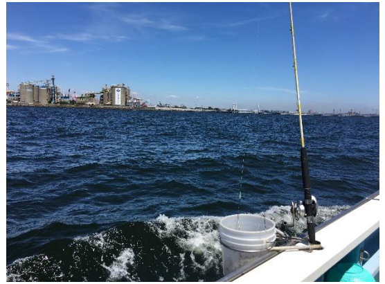
本牧沖、遠くにベイブリッジ