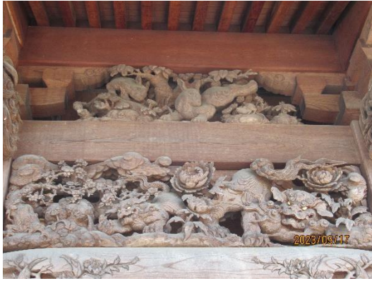
小野神社の随神門の彫刻