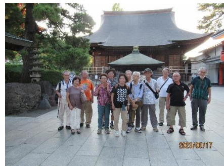
高幡不動尊の仁王門を背にして