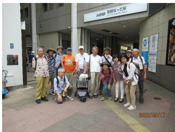
京王線・聖蹟桜ヶ丘駅にて