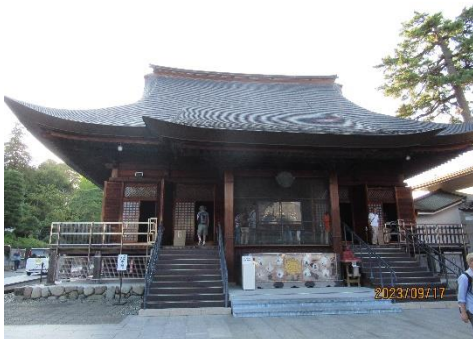
高幡不動尊の不動堂