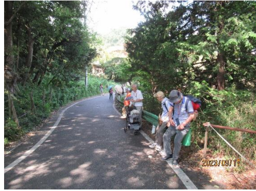
百草園に向かう途中、日陰での一休み