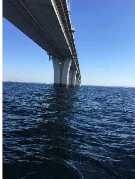
アクアライン直下で