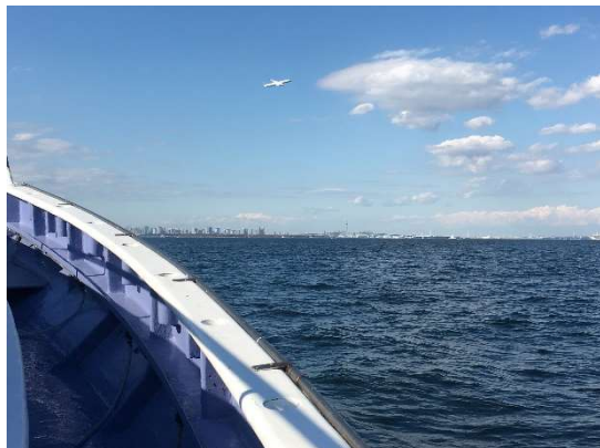
東京ゲートブリッジとスカイツリーを望む