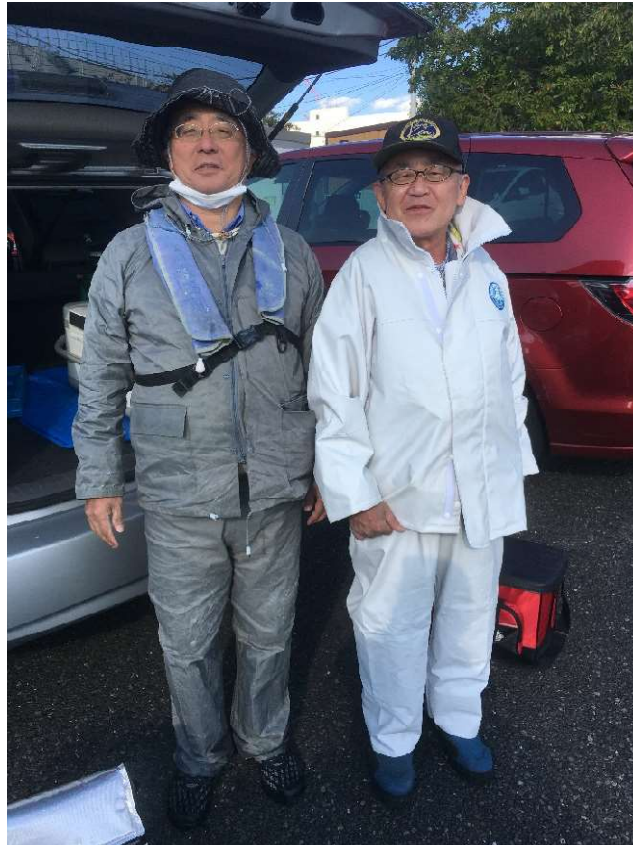
左から、碓会員、佐熊会員